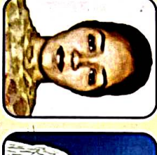
Bharti B.A. III 3rd Position