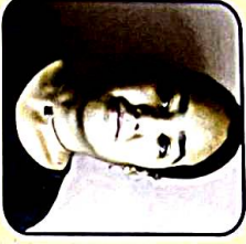
Shiana B.A. II 2nd Position