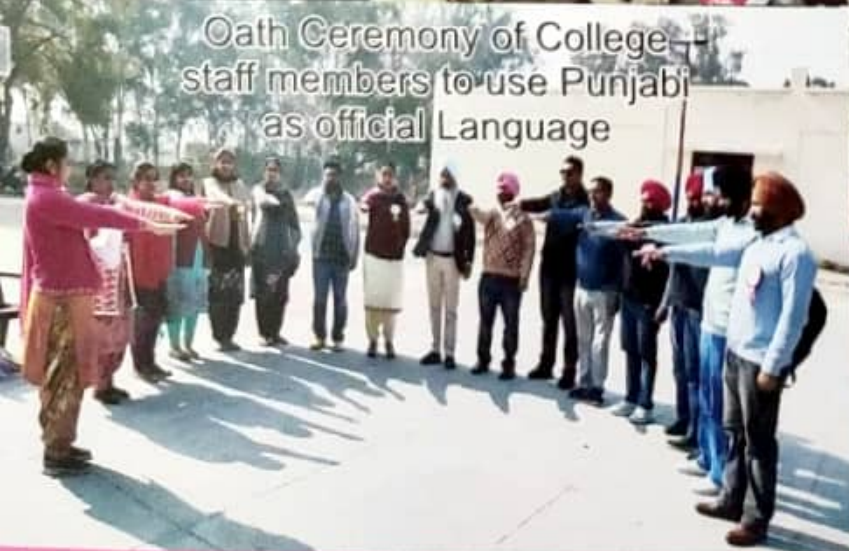
Oath Ceremony of College staff members to use Punjabi as official Language