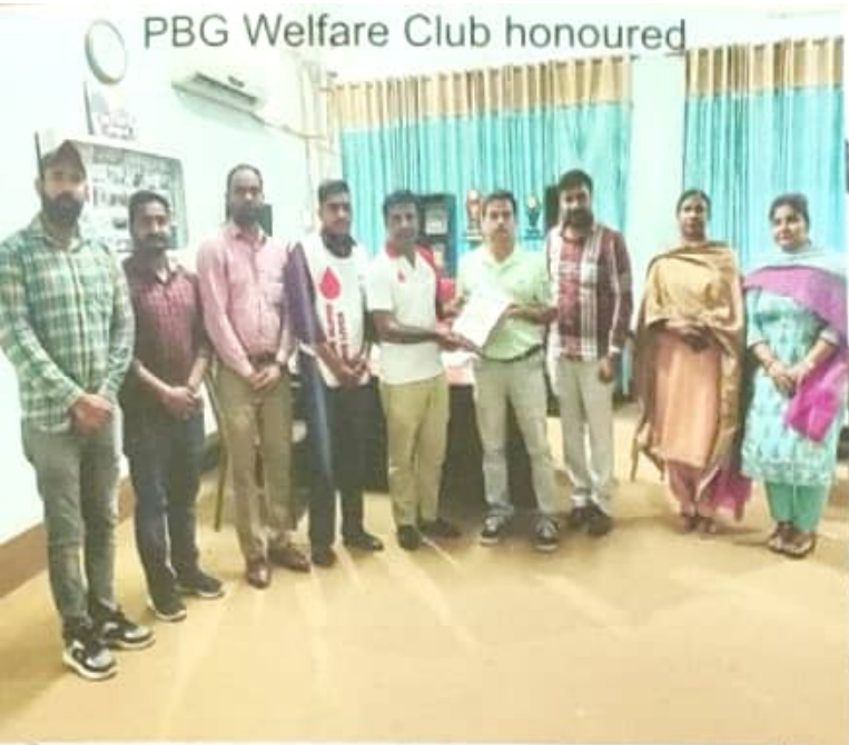
PBG Welfare Club honoured